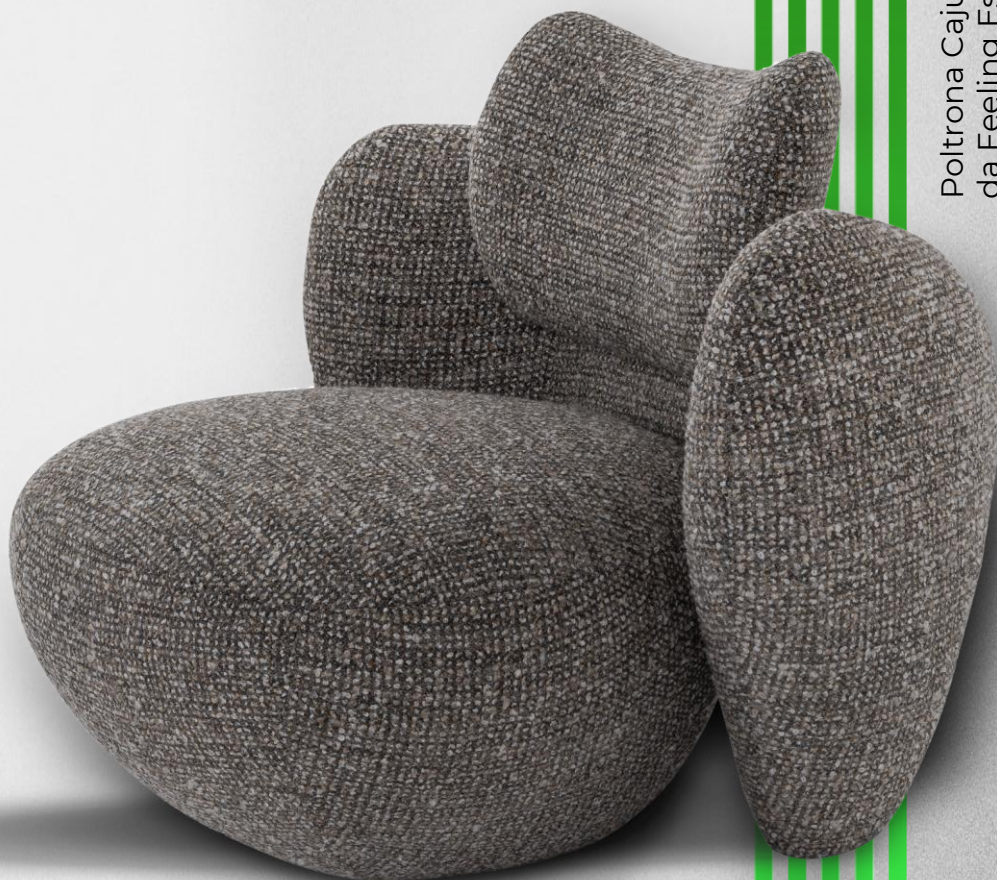
Poltrona Caju, da Feeling Estofados